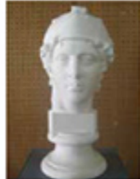
石膏像 青年マルス