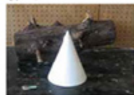
幾何石膏・陶伐材