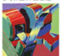
参考作品(平面構成)

引き出したテープの動きと構造体の立体表現及び赤・緑と青・黄の色彩対比による力強い作品です。