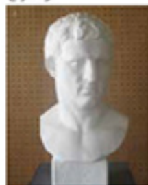
石膏像「アグリッパ」