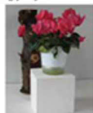
シクラメン(鉢植え)・幾何石膏(立方体)・陶伐材