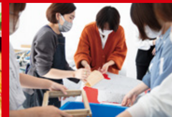
「プロジェクト ONICO」ペーパーワークの体験ワークショップ