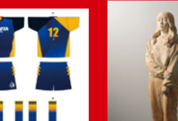
大分デザインエンド2022 <学生賞> 短大1年 4名が受賞