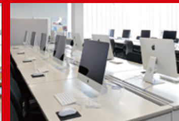
PC室はAdobe Creative Cloud他デジタル制作ソフトを導入