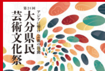
[第24回大分県民芸術文化祭]ポスター制作