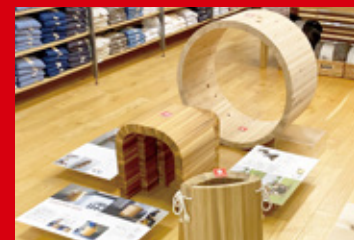
「スギのカタチ in 大分」/無印良品 トキハわさだタウン店