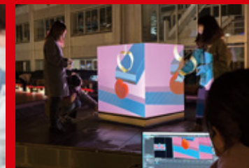
「おおいた光のファンタジー 2022」にてイルミネーションを展示