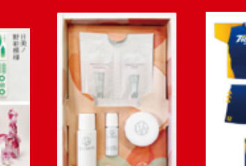
化粧品ブランド「LIOVERITE」 パッケージデザインコンペ <最優秀賞> 短大1年 田中ひかる