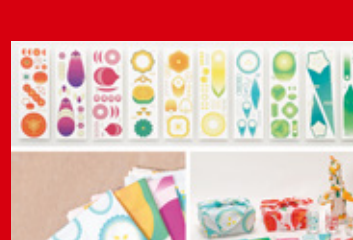
2022年グッドデザイン<ニューホープ賞> 「日美ノ野菜模様」専攻科1年 黒崎美羽