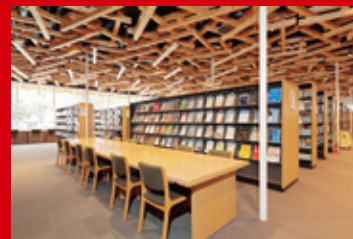
専門書や最新の雑誌が並ぶ図書館