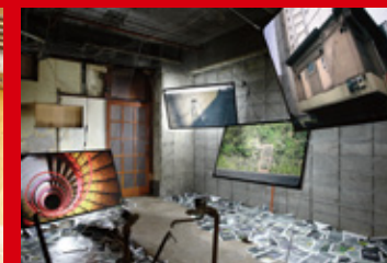
大分路上観察学会ふれぜんつ小藩分立トマソン探偵団2022