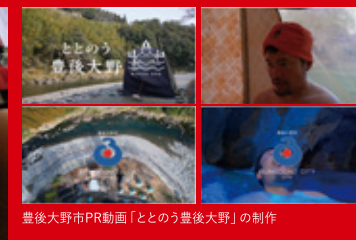
豊後大野市PR動画「とこのう豊後大野」の制作