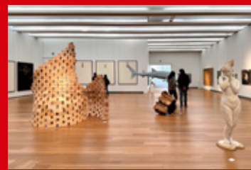
卒業・修了制作展/大分県立美術館(OPAM) 3F美術専攻・1Fデザイン専攻