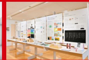
東京ミッドタウン・デザインハブ「ゼミ展2023」