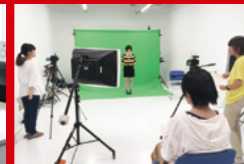
写真撮影用スタジオ。カメラの貸し出しも可