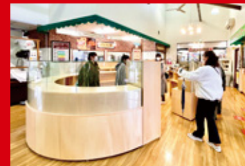
道の駅「童話の里くす」パンコーナーの空間創出