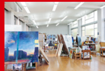
広々とした絵画実習室や石膏デッサン室、工房がある