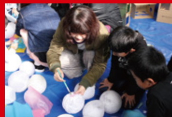
県内小学校を対象とした「ふれあいアート講座」