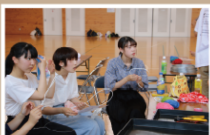
#シャボン玉の道具作り