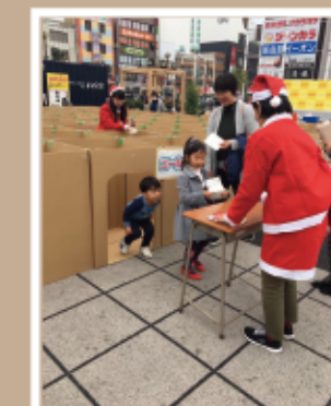
#サンタクロース #迷路