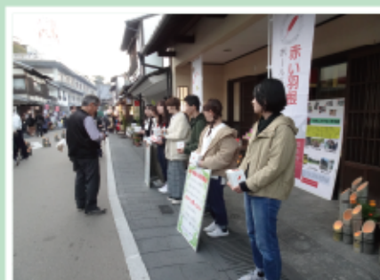
#募金活動 #赤い羽根