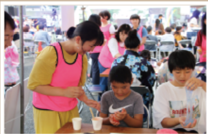
#ワークショップ #スライム作成