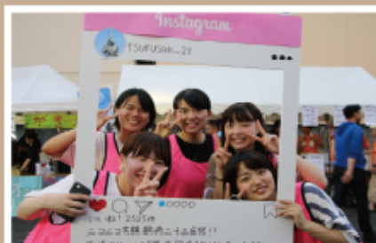
#学生たちで祭りを盛り上げました #鶴崎清正公二十三夜祭