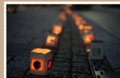
#キャンドルナイト #700個 #幼稚園生が描いた手作りのキャンドル