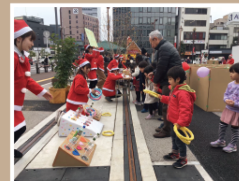
#「大分の子どもは大分の大人が育てる」 #わなげ