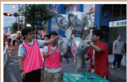
#当日 #7月23日 #国道1BAN