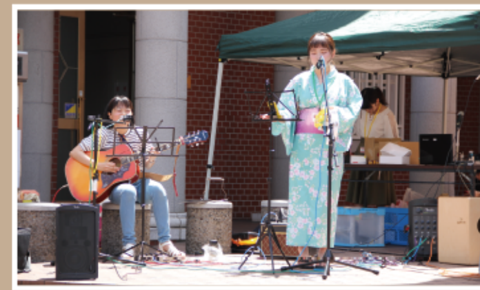
#ステージ発表 #軽音サークル #府内五番街