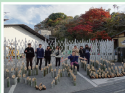
#大分 ☪ #竹籠デザイン