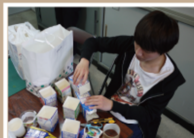
#キャンドルナイト作り #準備中