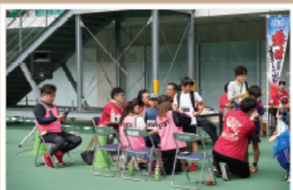
#予選会 #国道197号線を歩行者天国に

肥後藩の飛び地として栄えた大分市の鶴崎地区では、加藤清正公の命日を偲び、毎年7月23日に国道197号線を歩行者天国とした『鶴崎清正公二十三夜祭』を開催しています。