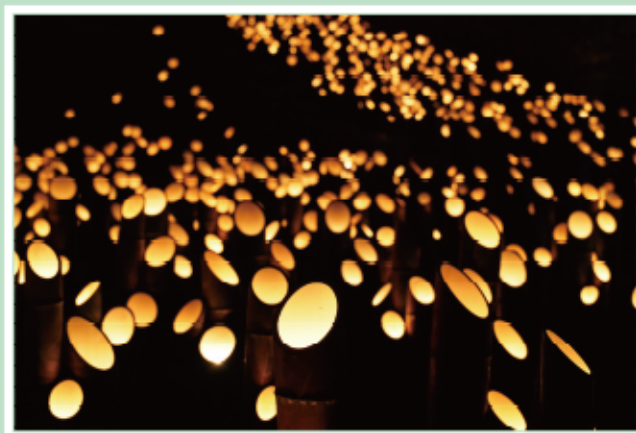
#竹灯籠 #たけたみつた #竹楽 #竹田

大分県竹田市で行われた「竹楽」に参加しました。毎年約2万本の竹灯籠が市内に設置され夜の竹田のまちを照らすとともに、数多くの観光客が国内外から訪れます。