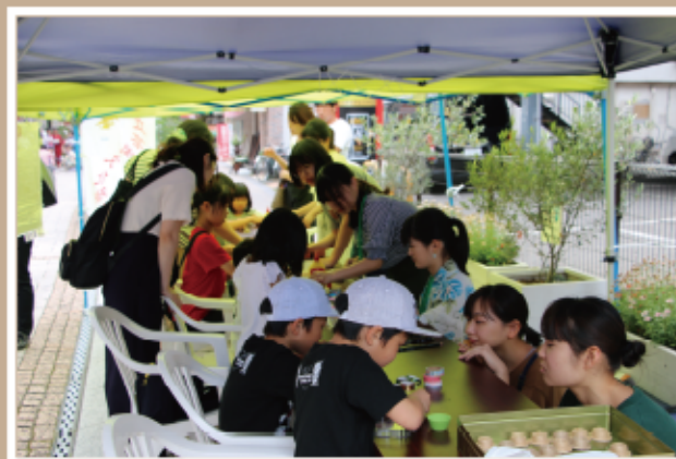
#ワークショップ #スーパーボール #スライム #射的 #エコキャップ

大分市内にある商店街の活性化を図るために活動が展開されました。府内五番街商店街組合と連携し、芸短生が中心となって1から企画、立案、準備、運営を行いました。