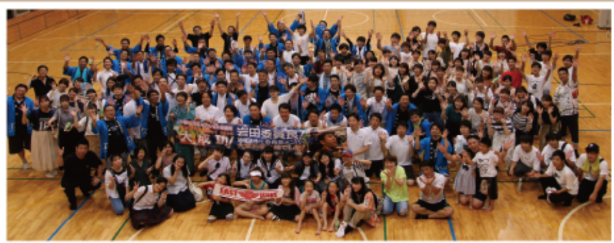
#大分活性化ネットワーク

「おおいた活性化ネットワーク」として大分青年商工会議所と市内の大学生が協力し、大分の活性化を目的として取り組みました。