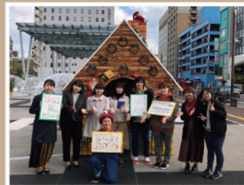
#祝祭の広場 #お菓子の家 #テレビ取材

本物のお菓子で飾りつけをして、会場に来ていただいたお子さんたちに持って行ってもらいました。このお菓子ですが、大分県菓子工業組合さんを通じて趣旨に賛同した企業の方々、個人の方など多方面からご支援を頂きました。約5,000人の親子連れを相手に大活躍でした。