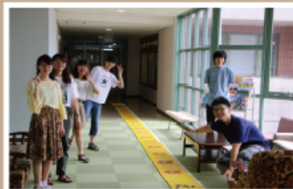
#エンタメバトル #横断幕作成