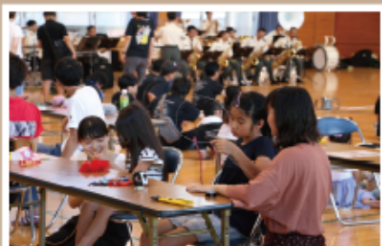
#子供たちと一緒に