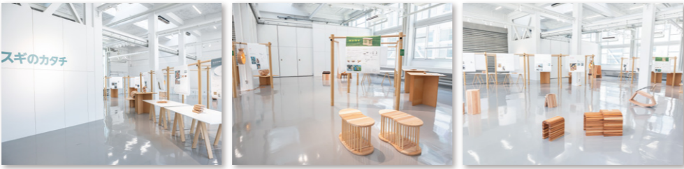
モビール 〈7月27日～8月6日〉 美術科 デザイン専攻 プロダクトデザインコース