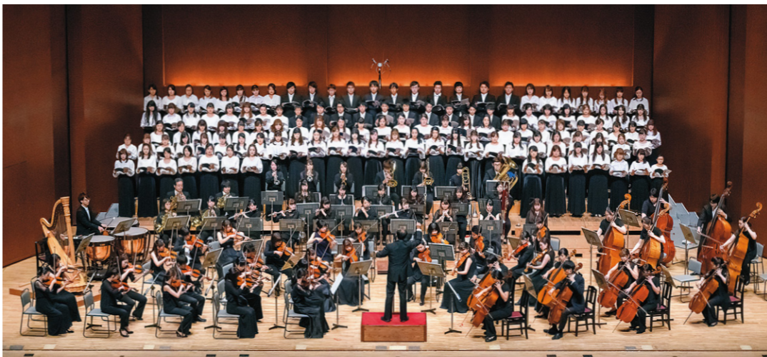
音楽科最大のイベント「第57回定期演奏会」を10月10日(日)にiichiko総合文化センターiichikoグランシアタで開催します。演奏はもちろん、当日のスタッフなど音楽科在学生・卒業生・教職員が丸となって作り上げていく演奏会です。ソリストはピアノ～管弦打～声楽と毎年代わり、今年はピアノに焦点を当てた構成です。今月の表紙を飾るソリストに選ばれた学生3名に、演奏する曲の魅力や定期演奏会へ向けた意気込みを伺いました。