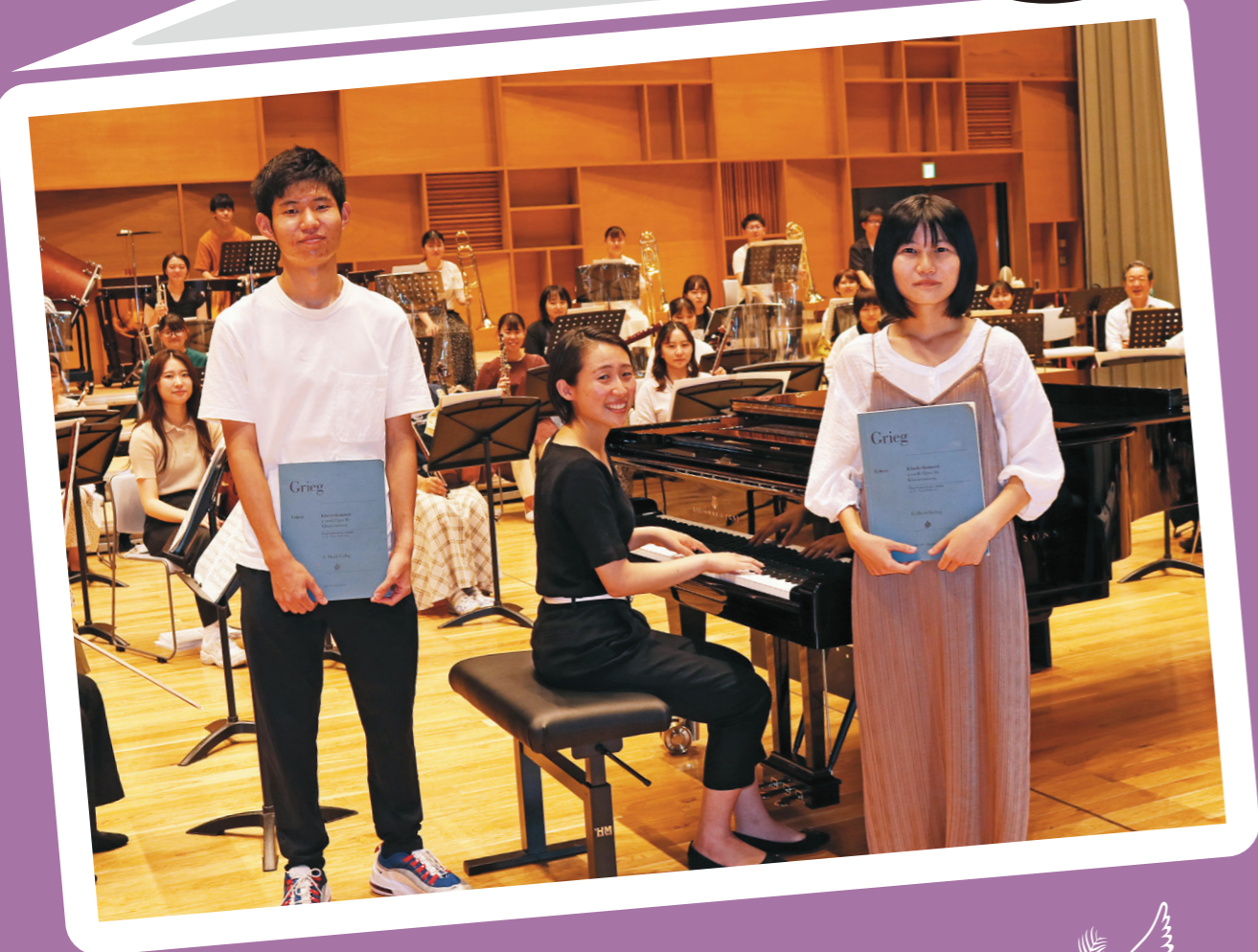
大分県立芸術文化短期大学広報誌 エピストゥラ