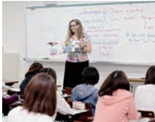
英語コミュニケーション

外国語(英語、フランス語、中国語、韓国語)による実践的コミュニケーション能力を育成します。