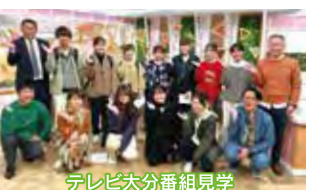
テレビ大分番組見学