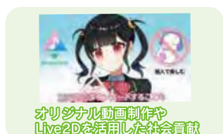
オリジナル動画制作やLive2Dを活用した社会貢献