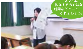
スマホに依存するのではなく、新聞などでニュースにふれましょう。