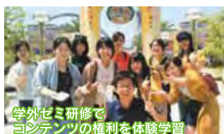
校外ゼミ研修でコンテンツの権利を体験学習