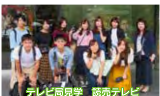
テレビ局見学 読売テレビ