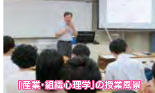
「産業・組織心理学」の授業風景

研究テーマは、「話し合い」(集団意思決定)や「指導性」(リーダーシップ)の心理学ですが、どうすれば、そうした力やスキルが身につくのかという観点から、人間関係トレーニングの授業実践(グループワーク論)にも取り組んでいます。