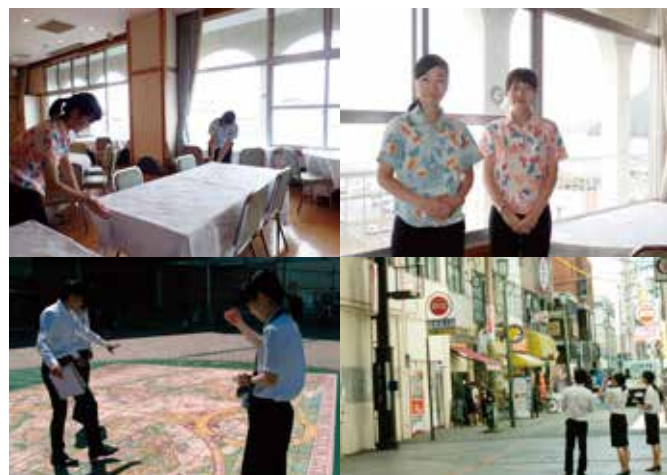
(上段) ホテル・ニューツルタでのインターンシップ。 パンケットの会場設営、受付接客補助の様子。

今年の夏休みも、本学の進路支援室が主体となって、「インターンシップ」が実施されています。就業体験の実施先は、県内の行政機関をはじめ、ホテルや企業など、約70件におよび、参加学生数は約220名です。インターンシップでご協力くださっている各機関・企業などへ、お礼申し上げます。